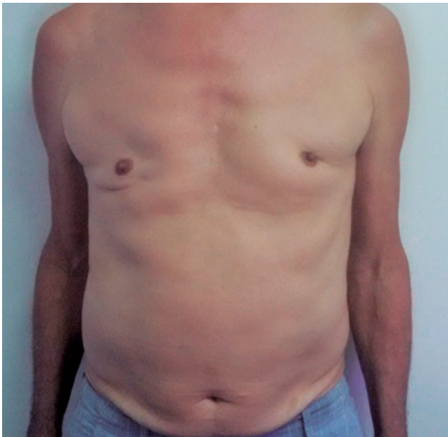
Figura 2. Cicatrizes cirúrgicas da correção de ginecomastia

e amplitude aumentadas. No estudo de neurocondução dos MMSS, foi notada condução sensitiva inexcitável e condução motora exibindo latências aumentadas no nervo mediano bilateralmente.